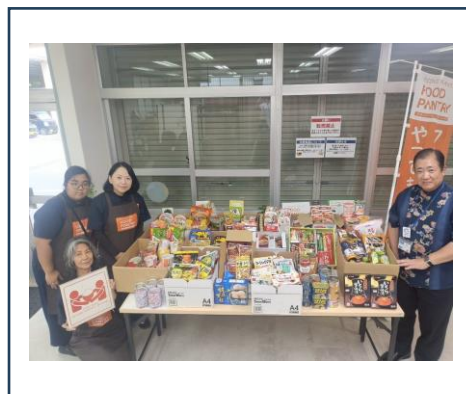
ろうきんさんからフードドライブ食品の寄付