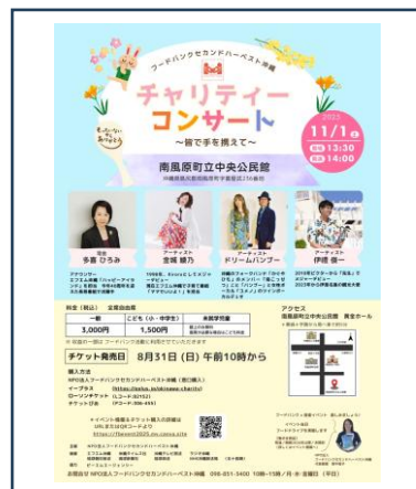
協力者を増やす目的のチャリティーコンサートを企画(11月1日)