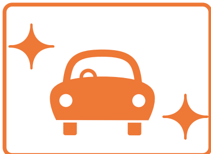
新車・中古車購入